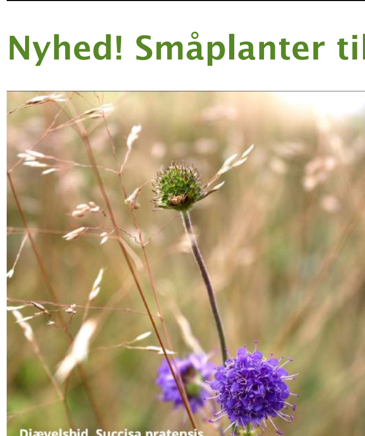
Djævelsbid, Succisa pratensis