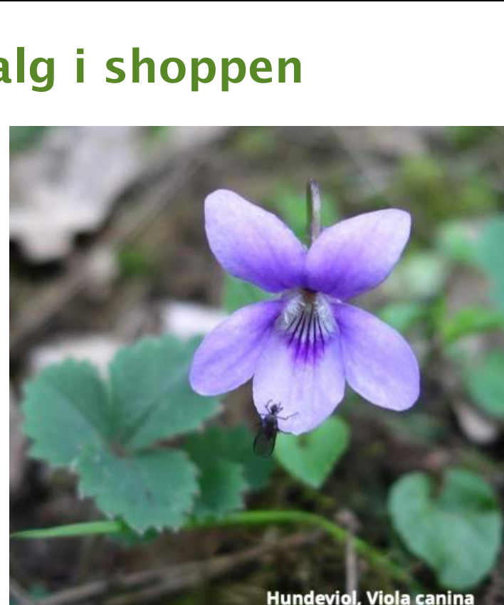
Hundeviol, Viola canina

Mangler du et drivhus, drivbænke eller andet egnet sted til at spire frø, men stadig vil dyrke planterne selv, kan det være en god ide at købe småplanter frem for frø.