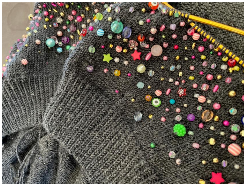
Et eksempel på en trøje strikket med mange forskellige perler.

Find dine perler frem og beslut dig for, om du vil bruge flere farver eller holde dig til en.