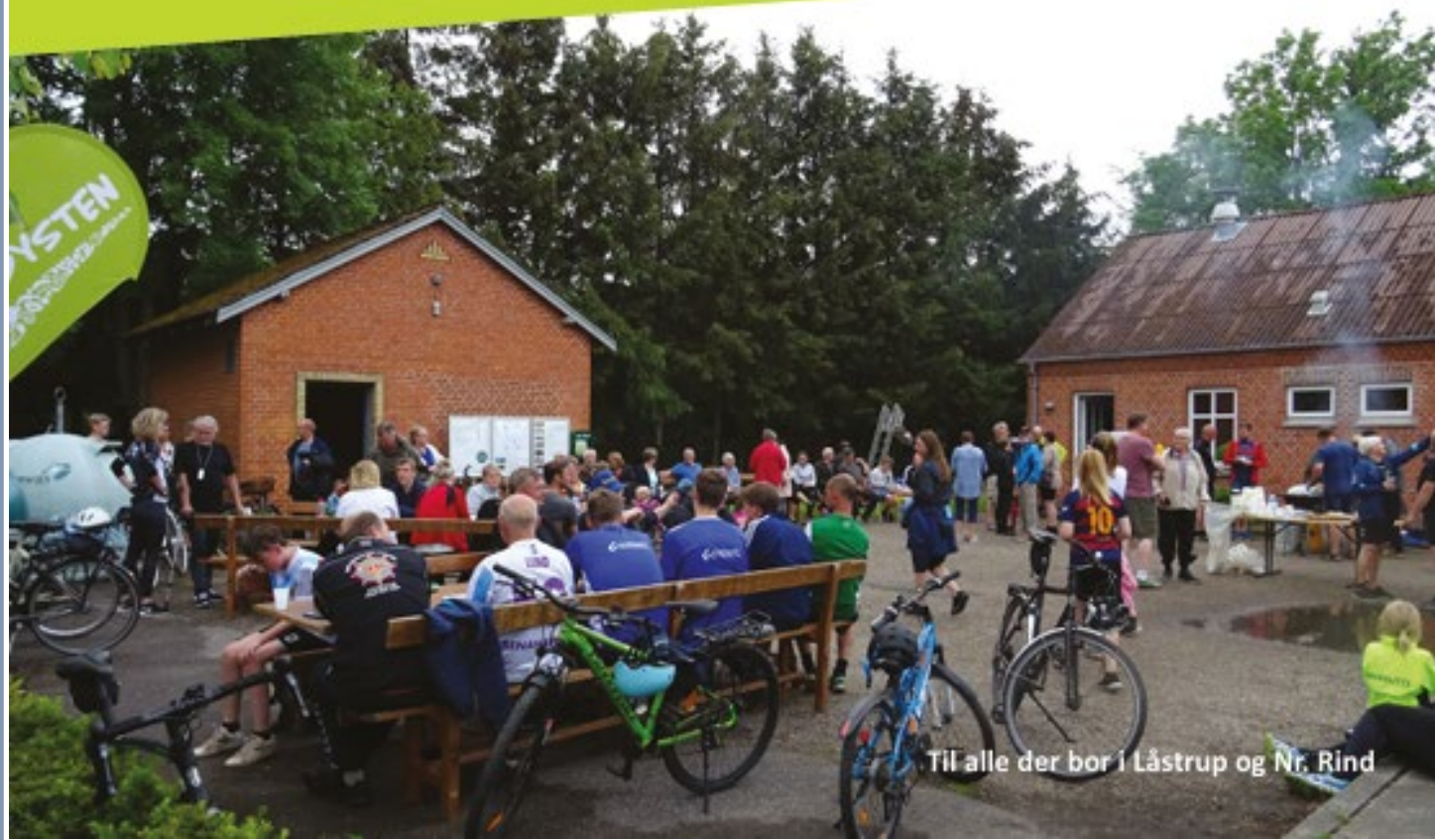
Til alle der bor i Låstrup og Nr. Rind